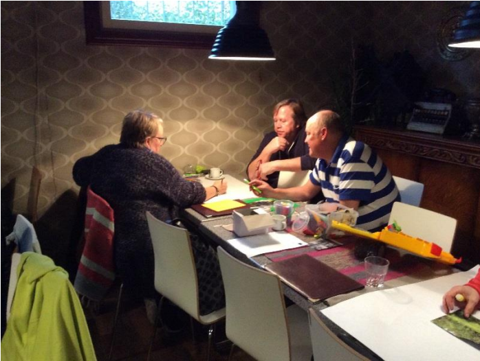
Kuva 2: suunnittelua palvelumuotoilun keinoin

Työpajoissa saimme suunniteltua Röllipuiston kokonaisuuden (kuvat 3 ja 4) ja pilkottua toteutuksen prosessiksi. Oulun kaupungin budjetti oli 10 000€, jonka jakamisesta osiin olimme myös kuulleet. Suunnitelimme siis kokonaisuuden huomioiden budjetin.