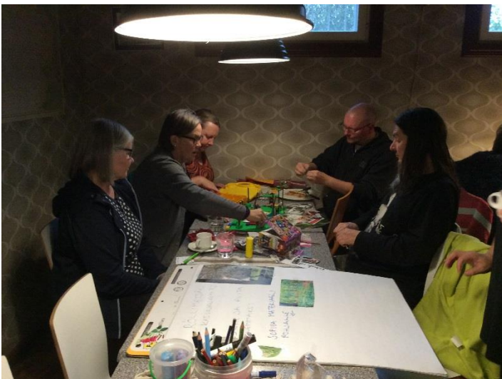
Kuva 1: suunnittelua palvelumuotoilun keinoin

Lokakuussa 2018 järjestimme kolme työpajaa, jossa palvelumuotoilun keinoin (kuva1 ja 2) suunnittelimme Röllimetsän muutosta, annoimme asialle nimeksi Rölli puiston kasvojen kohotus.