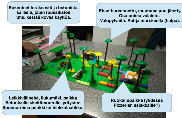
Kuva 3: Röllimetsän kasvojenkohotus